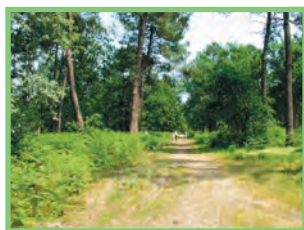
Forêt du Bourgaillh