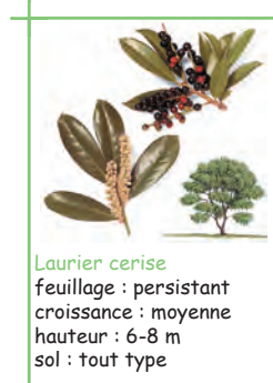
Laurier cerise feuillage : persistant croissance : moyenne hauteur : 6-8 m sol : tout type