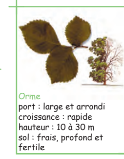
Orme port : large et arrondi croissance : rapide hauteur : 10 à 30 m sol : frais, profond et fertile