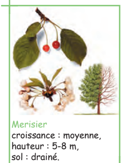
Merisier croissance : moyenne, hauteur : 5-8 m, sol : drainé.