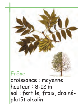
Frêne croissance : moyenne hauteur : 8-12 m sol : fertile, frais, drainé- plutôt alcalin