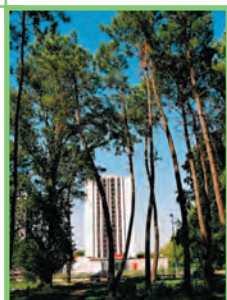
Campus depuis le bois de Saige

Ce caractère rural champêtre et domestique doit pouvoir s'exprimer dans les projets en puisant dans le vocabulaire paysager et architectural né du bocage et des modèles régionaux : en ce sens, recourir, dans une composition contemporaine, aux matériaux rustiques, laisser une place importante pour le végétal, utiliser des espèces champêtres, conduites en formes libres, en cépée, ou en taillis constituent des éléments de réponse intéressants.