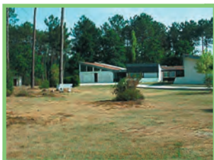
Rue du Blayais