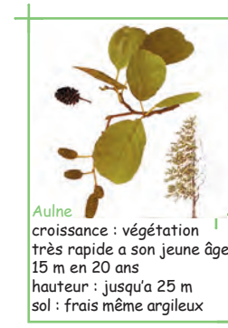
Aulne croissance : végétation très rapide a son jeune âge 15 m en 20 ans hauteur : jusqu'à 25 m sol : frais même argileux