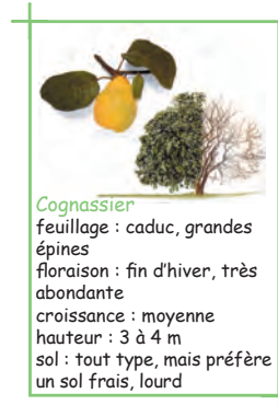
Cognassier feuillage : caduc, grandes épines floraison : fin d'hiver, très abondante croissance : moyenne hauteur : 3 à 4 m sol : tout type, mais préfère un sol frais, lourd