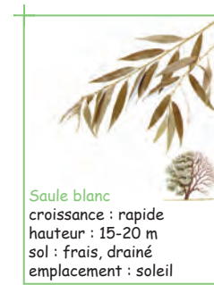
Saule blanc croissance : rapide hauteur : 15-20 m sol : frais, drainé emplacement : soleil