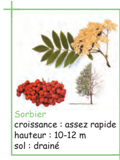
Sorbier croissance : assez rapide hauteur : 10-12 m sol : drainé

Le vert sombre de l'horizon forestier, le vert tendre du sol forment les couleurs dominantes du paysage de lisières. Quant à la palette végétale, elle est constituée d'essences familières, rustiques, indigènes ou naturalisées, échappées des enclos agricoles et des jardins.