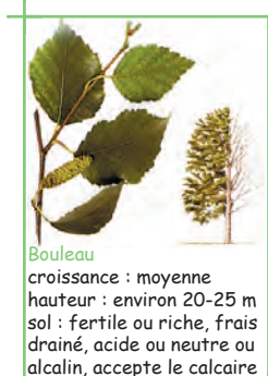
Bouleau croissance : moyenne hauteur : environ 20-25 m sol : fertile ou riche, frais drainé, acide ou neutre ou alcalin, accepte le calcaire