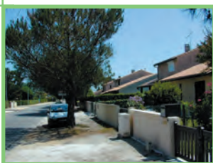
Avenue de Bretagne