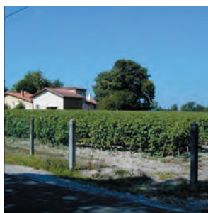
Vignes rue du plateau de Noès