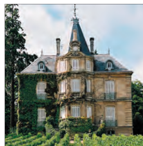
Château Les Carmes-Haut-Brion